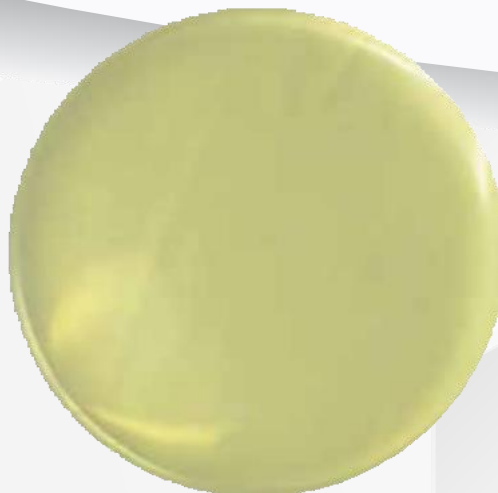
Imagen 1: Medio de cultivo agarizado (PCA Sin Inhibidor)

Evitar dejar burbujas de aire entre la membrana y el medio.